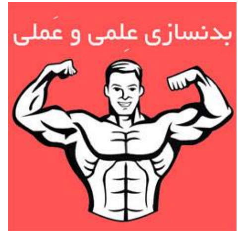
اطلاعات بیشتر و دریافت