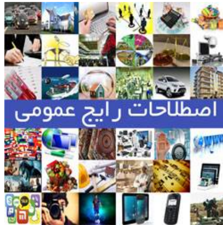
اطلاعات بیشتر و دریافت