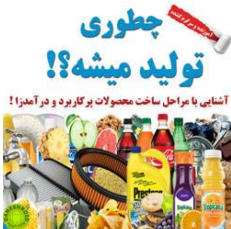
اطلاعات بیشتر و دریافت